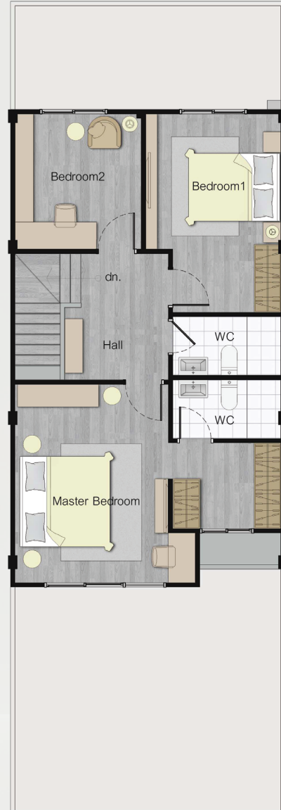
2 nd FLOOR PLAN