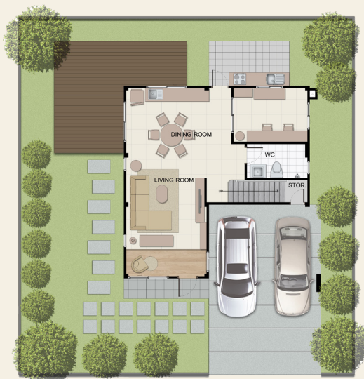
1 st FLOOR PLAN