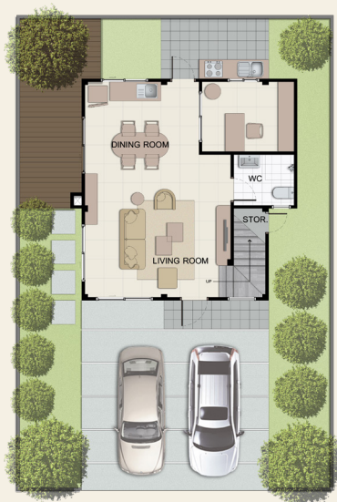
1 st FLOOR PLAN